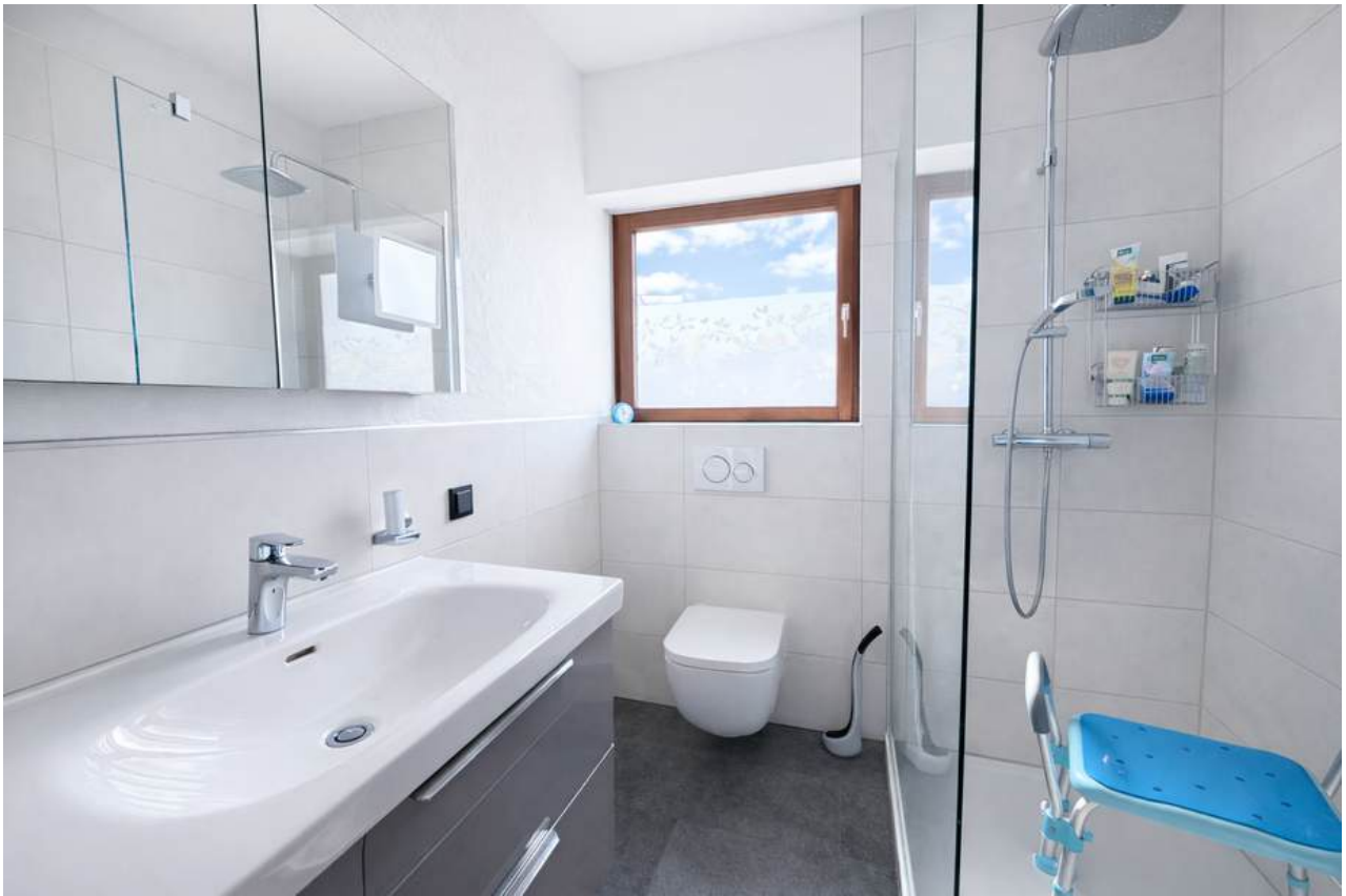
Modernisiertes Badezimmer mit altersgerechter Dusche und reichlich Tageslicht