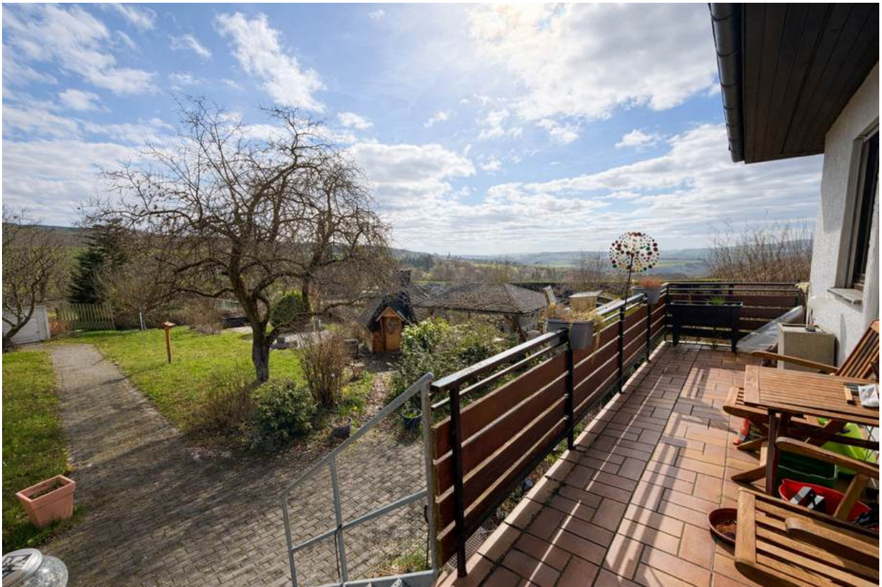
Ansichten von den beiden Terrassen vom Haus mit tollem Ausblick ins Grüne - Ideal zum Entspannen