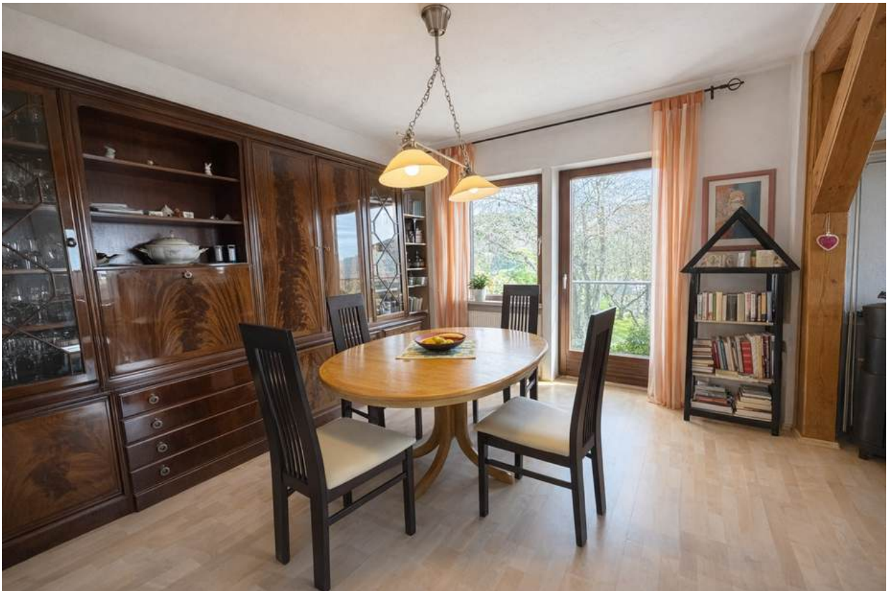
Großes Wohnzimmer mit Essbereich und Zugang zur Terrasse und Garten