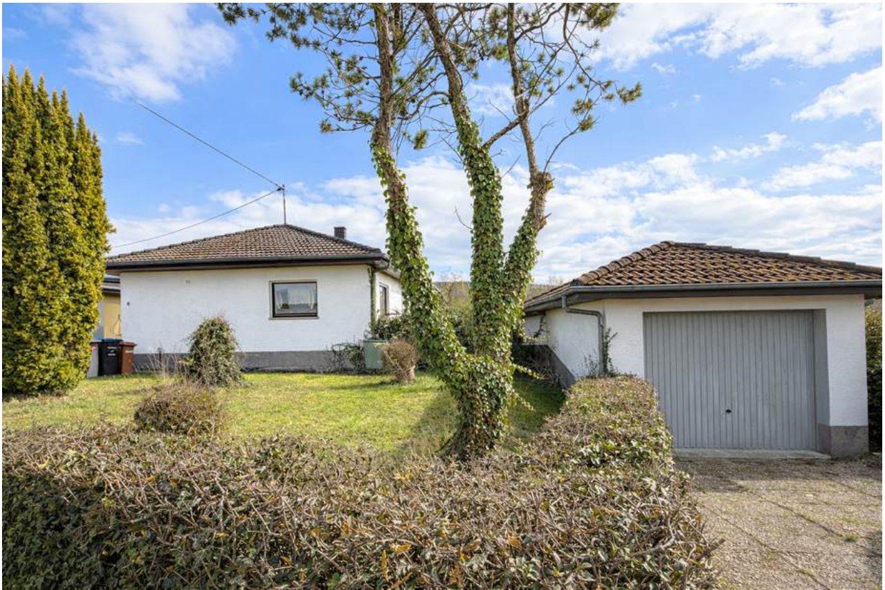
Front-Ansicht vom Eingangsbereich der Immobilie und der Garage