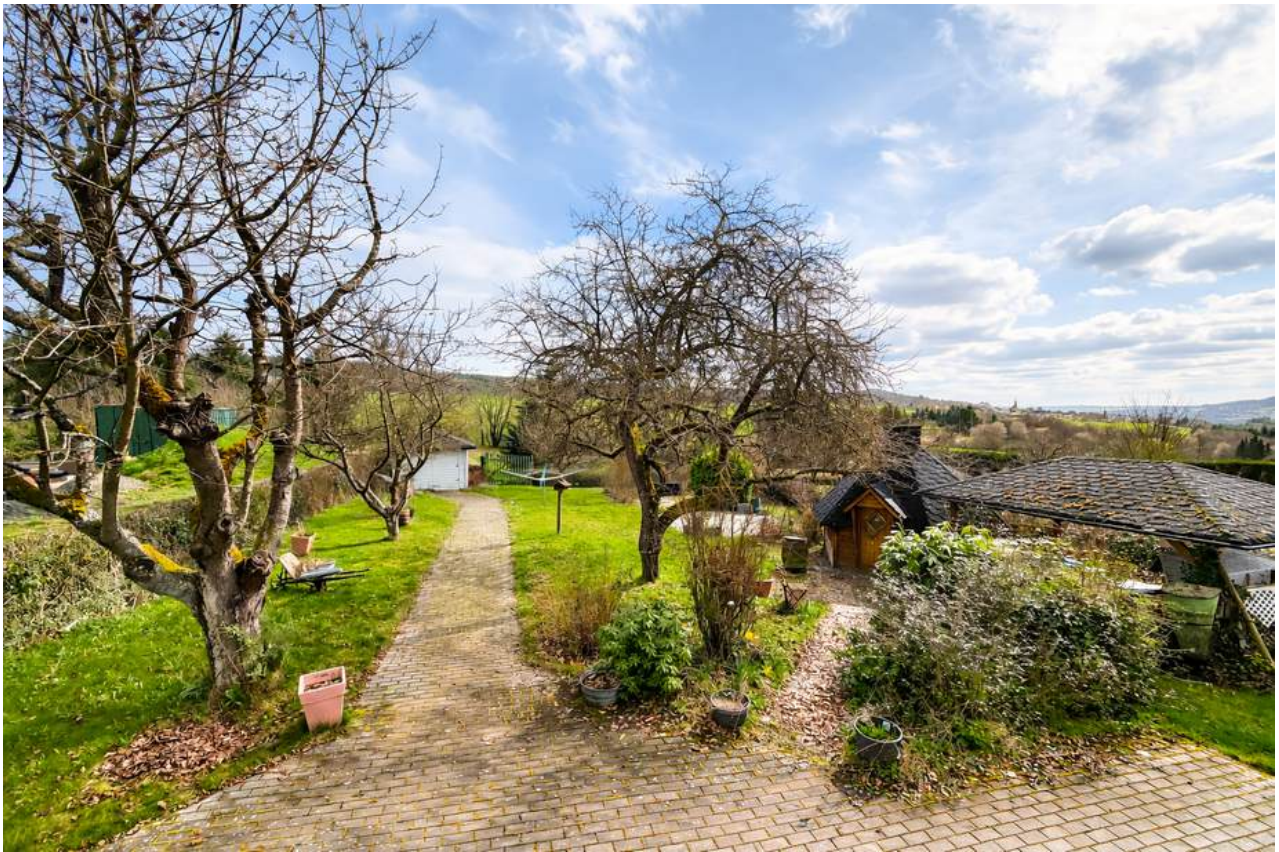
Traumhafter Garten mit Grünfläche und Gartenhäuschen