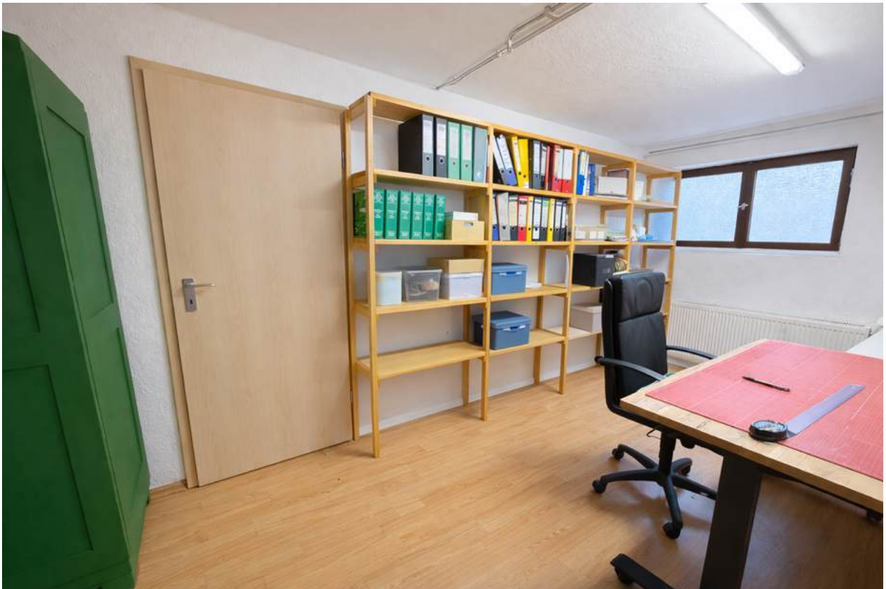
Arbeitszimmer / Home Office im UG