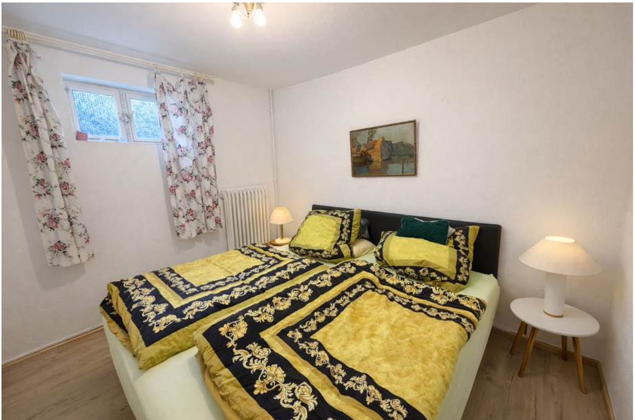
Mögliches Gäste Zimmer oder Arbeits- / Hobbyzimmer im UG