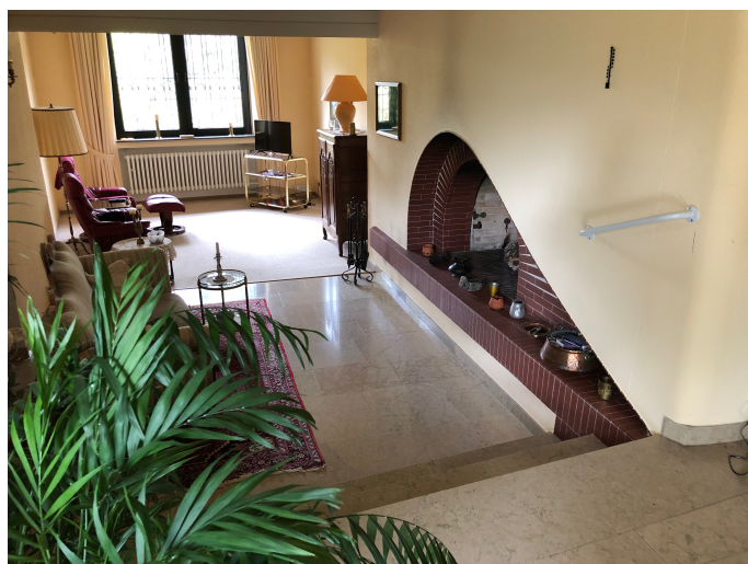
Kaminbereich Perspektive 2

Aydin Özdemir IMMOBILIENMAKLER & BAUTRÄGER