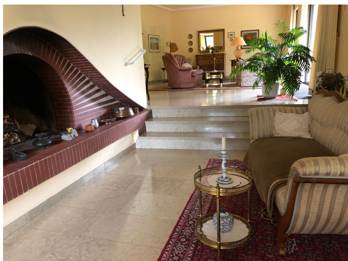
Kaminbereich Perspektive 1